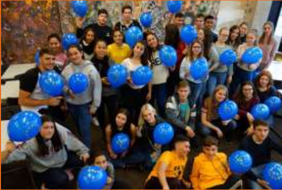
Exposición de fotos "También nosotros somos Europa"