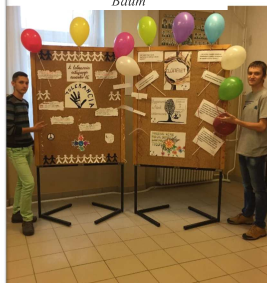
November 16-án, Magyarországon több rendezvény is megvalósult.