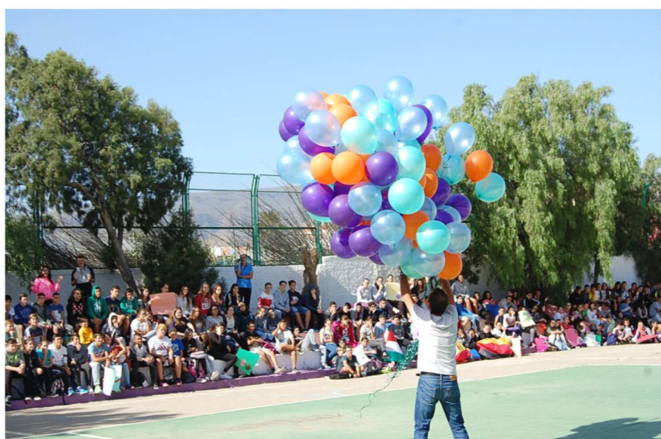
Tiszta égbolton szálltak a léggömbök azzal az üzenettel: „Nálunk nincs helye a rasszizmusnak“