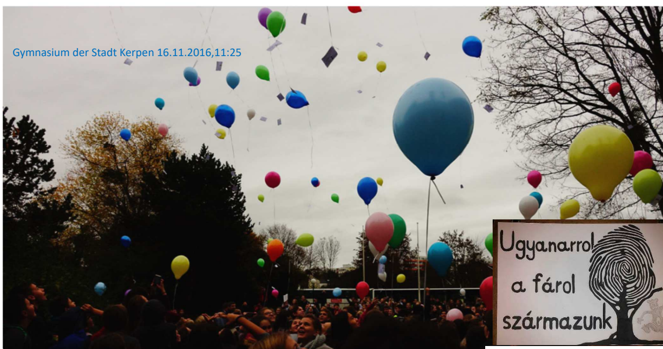
Gymnasium der Stadt Kerpen 16.11.2016,11:25

Ezúton is szívből köszönjük mindenkinek, akik a véleményüket a „mi a tolerancia” kérdésben kifejtették, és közreműködtek: diákoknak, tanároknak, szülőknak és a technikai munkacsoportnak is.