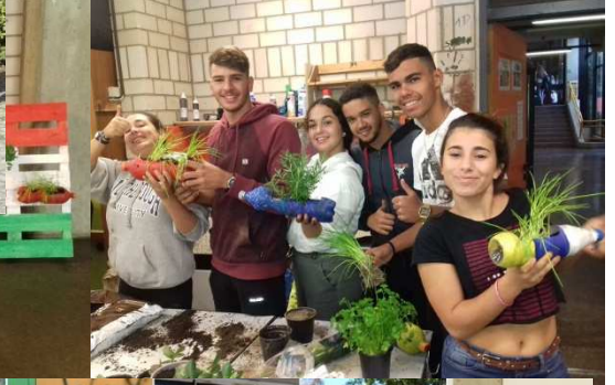
Néhány fotó a tanárcseréről a három országban