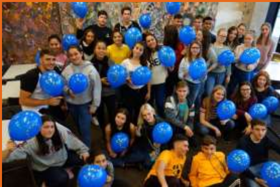
Fotókiállítás „Auch wir sind Europa“ (Mi is Európához tartozunk)

Romák, menekultek és bevándorlók találkozása!